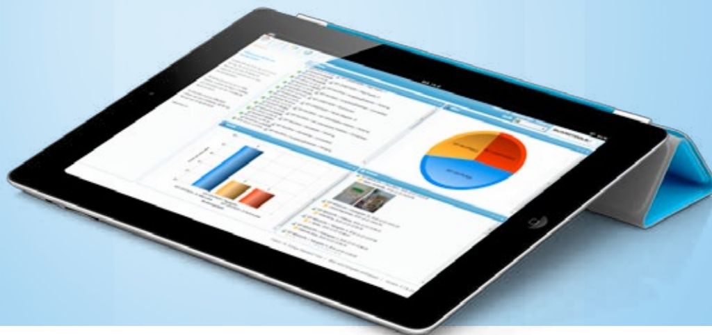
GuardTools Web dargestellt auf einem Apple iPad

Unser Operation Support System hilft Ihnen, sich mit Ihrem Unternehmen von anderen hervorzuheben . Das solide, digitale Arbeitskonzept zur Planung, Durchführung, Kontrolle und Analyse von Sicherheitsleistungen unterstützt Sie dabei Ihren Kunden einen gleichbleibenden und qualitativ hochwertigen Service zu bieten. Dies ermöglicht es Ihnen, dem Massengeschäft von Sicherheitsdienstleistungen mit Preiskonkurrenz zu entgehen .